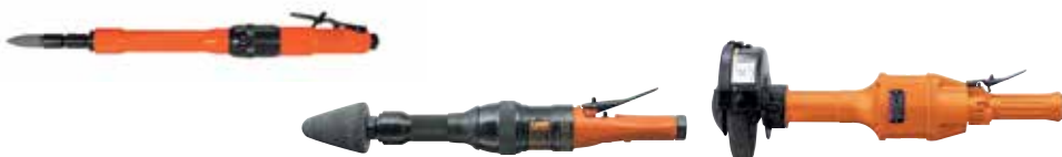
Muela recta de rectificado