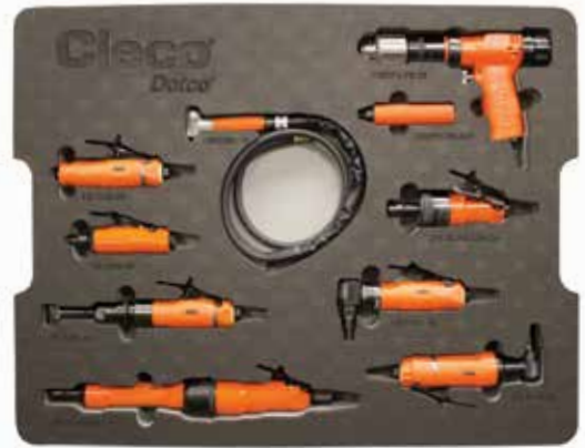
Ejemplo: capa superior de la caja de muestra de eliminación de materiales completa

Nuestros expertos en eliminación de materiales trabajarán con usted para configurar su caja de muestra individual de Cleco Dotco.