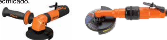
Muela de laminas