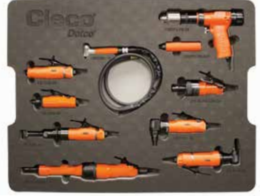
Örnek: Kapsamlı Talaş Kaldırma Demo Kitinin üst katmanı

Talaş Kaldırma uzmanlarımız sizinle birlikte çalışarak size özel Cleco Dotco Demo Kitini oluşturur.