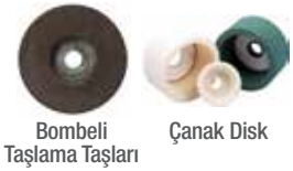
Bombeli Taşlama Taşları