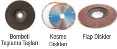
Bombeli Taşlama Taşları