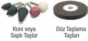
Koni veya Saplı Taşlar